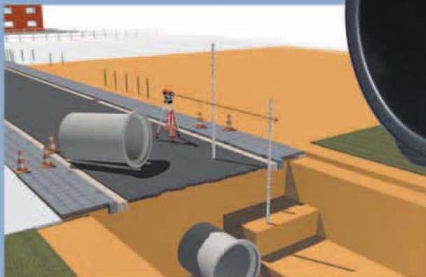
تراز به کمک پایه مرجع